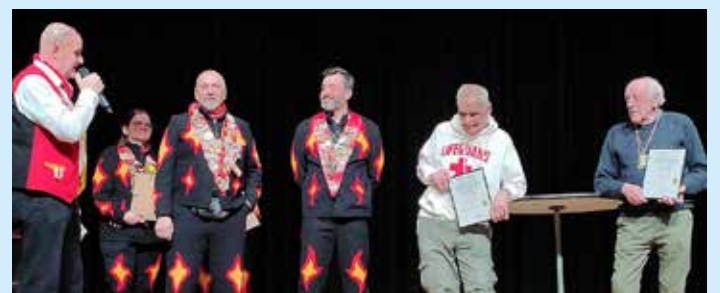
Vier Ehrungen mit Urkunde.

Soldarsteller und kleine bis größere Gruppen der Vereine boten ihr Einstudiertes an. Ganz zu Beginn der Narrennachwuchs der Feurigen Salamander. Dann so nach und nach die Älteren. Ebnet und seine Vorkommnisse wurden durchgenudelt: Die Nachhaltigkeit in Ebnet mit dem Tannenbaum zu Weihnachten, der jetzt auch Narrenbaum ist und, wie mitgeteilt wurde, danach weiter stehenbleibt, um als nachhaltiger Maibaum sein Leben auszuhauchen.